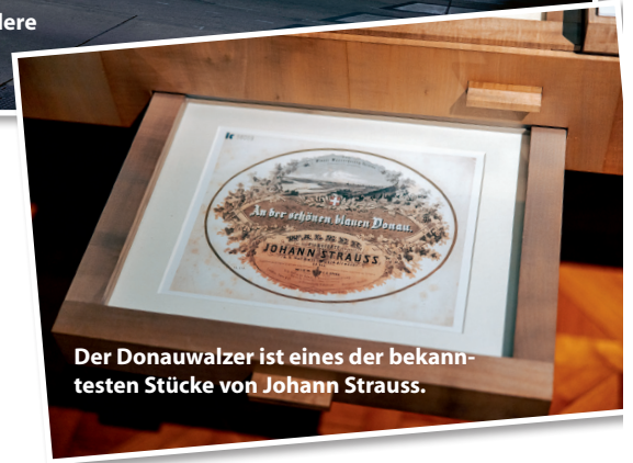
Der Donauwalzer ist eines der bekanntesten Stücke von Johann Strauss.

die Wirkung von Strauss auf die Theaterwelt beleuchten. Interaktive Stationen laden zum Mitmachen ein – vom Dirigieren bis zum Walzertanzen.