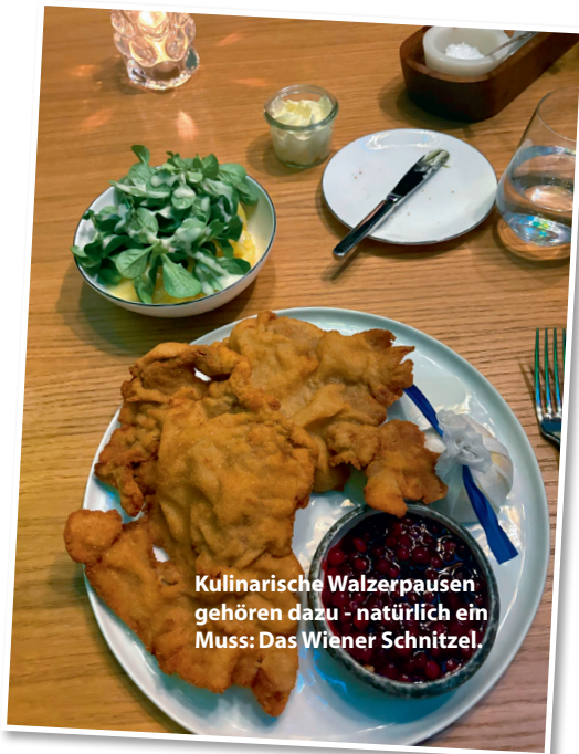
Kulinarische Walzerpausen gehören dazu - natürlich ein Muss: Das Wiener Schnitzel.