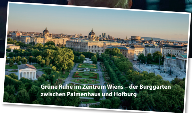
Grüne Ruhe im Zentrum Wiens – der Burggarten zwischen Palmenhaus und Hofburg