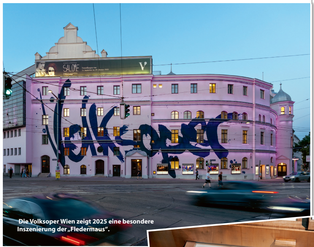
Die Volksoper Wien zeigt 2025 eine besondere Inszenierung der „Fledermaus“.