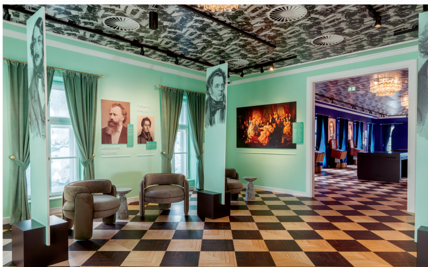
Das neu eröffnete House of Strauss vereint Museum, Konzertsaal und Restaurant unter einem Dach