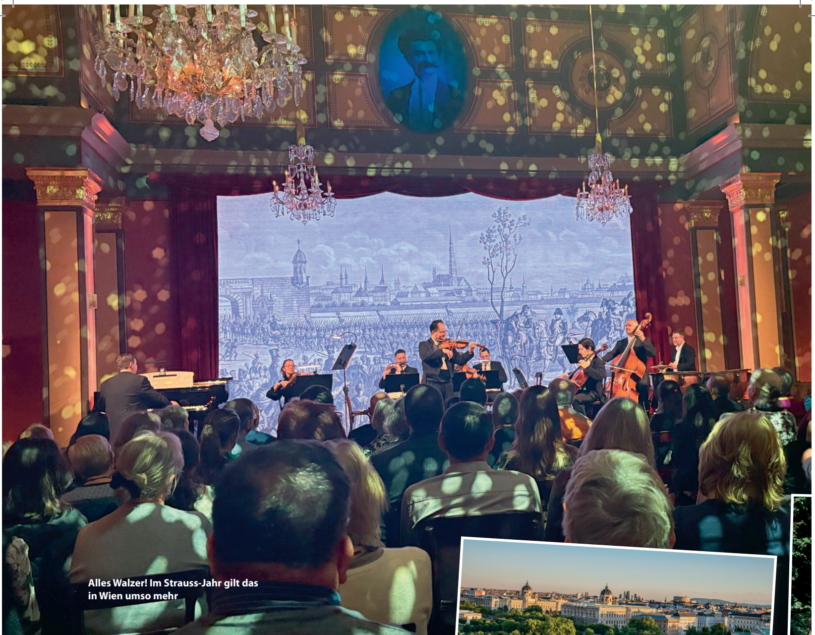
Alles Walzer! Im Strauss-Jahr gilt das in Wien umso mehr